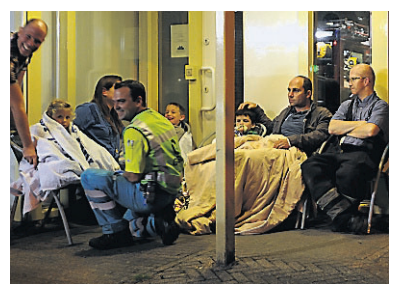
Zwembad Vital in Loon op Zand.