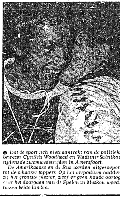
De sport zich niet aantrekt van de politiek, bevesten Cynthia Woodhead en Vladimir Salnikov tijdens de vierdaagse wedstrijden in A. mensfort.